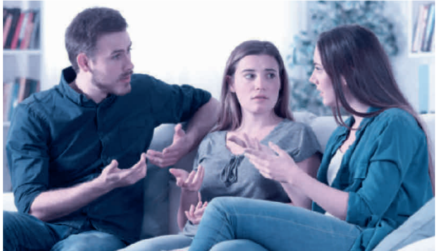
Kommt es zum Streit zwischen den Erben, muss der Willensvollstrecker schlichten.

Der Willensvollstrecker setzt den letzten Willen des Erblassers um. Dafür stellt er als Erstes ein Inventar auf, das er laufend nachführt. Er verwaltet die Erbschaft bis zur Teilung und muss darauf achten, dass das Vermögen erhalten bleibt. Er bezahlt die Schulden des Erblassers inklusive der Todesfallkosten und treibt offene Forderungen ein. Zur Verwaltung gehören auch die laufenden Geschäfte, beispielsweise muss er sich um den Unterhalt von Liegenschaften kümmern, laufende Verträge kündigen oder allenfalls die Liquidation einer Einzelunternehmung umsetzen. Er ist verantwortlich für die Erstellung der